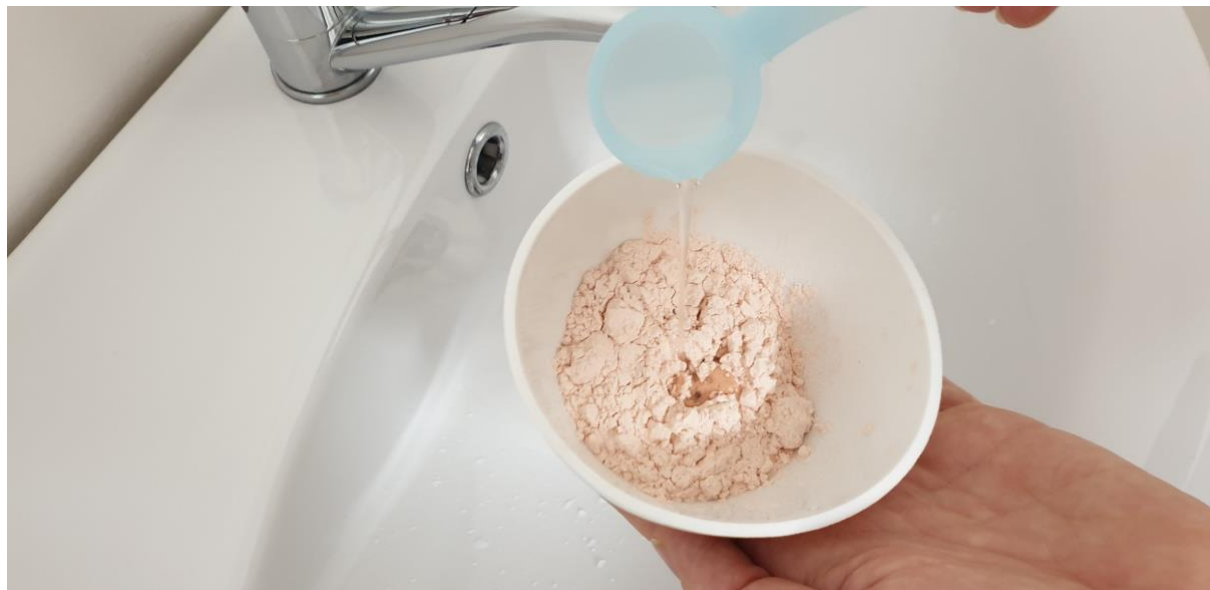
Foto postup aplikácie modelingovej masky